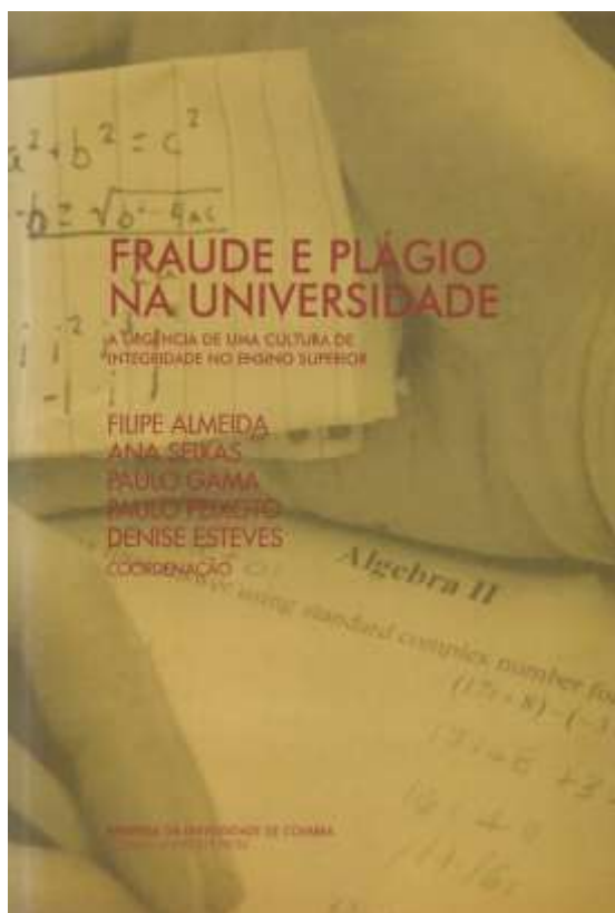
Figura 1. 1